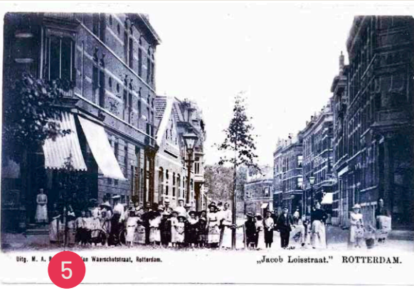
1903, Jacob Loisstraat rechtsvoor 'Emstermate' (uitgeverij M.A. Broekmans)