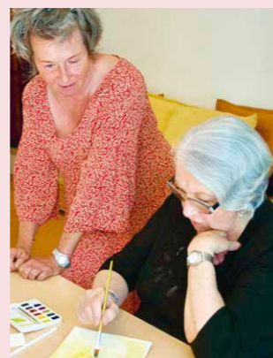
Aquarelleren bij 'Potlood en Penselen'