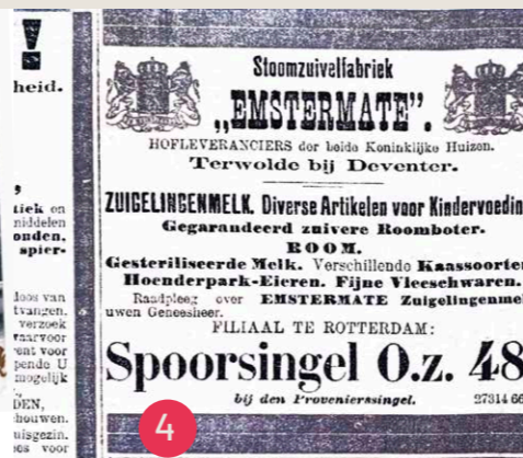
Maasbode 3/1/1903, Spoorsingel hoek Jacob Loisstraat advertentie 'Emstermate'