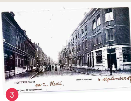
1900, Jacob Loisstraat vanaf Van der Sluysstraat genomen Uitgeverij C. de Jong Jong, 33 Versijdenstraat