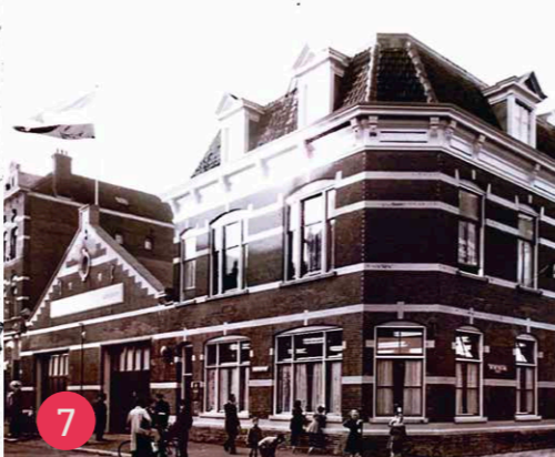
1954-1970, Het Verkade gebouw Jacob Loisstraat/Van der Schellingstraat met de vlag in top, en spelende kinderen