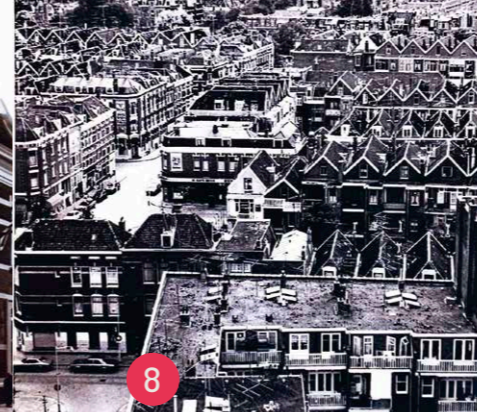
1979, zicht op Jacob Loisstraat vanaf flat Ungerplein