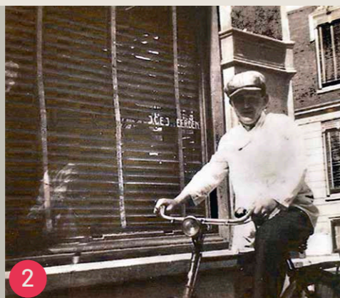
1900, foto's J.C.D.J. van Eerden bakkerij (Pieter de Raadt/hoek Jacob Lois)