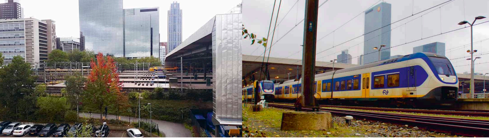
Monumentale platanen op het Delftseplein